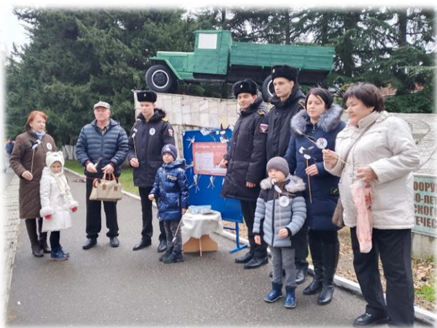
Воспитатель 51 учебной группы

18 января 2024 года кадеты 10 «А» класса совместно с воспитанниками подготовительной группы детского сада «Красная шапочка» провели патриотическую акцию «Блокадная ласточка» возле памятника «Дорога Жизни». «Блокадная ласточка» — символ осажденного Ленинграда. Немецкие захватчики, держащие осаду города, заявили: «Отныне даже птица не сможет пролететь через кольцо блокады!» Многие ленинградцы носили жестяную «Блокадную ласточку» с письмом в клюве на груди в ответ на заявления фашистов, демонстрируя тем самым, что ждут хороших вестей и не теряют связи со своей страной. Жетон так и назывался «Жду письма» и символизировал ожидание весточки от близкого человека, воевавшего на фронте или уехавшего в эвакуацию, веру в то, что он жив. Блокадная ласточка День старта акции выбран не случайно. Именно 18 января было разорвано блокадное кольцо вокруг города Ленинграда. Прорыв блокады стал переломным моментом в этой битве. Пусть Блокадная ласточка будет символом надежды, как когда то в блокадном Ленинграде. Чтобы помнить и никогда не сдаваться.