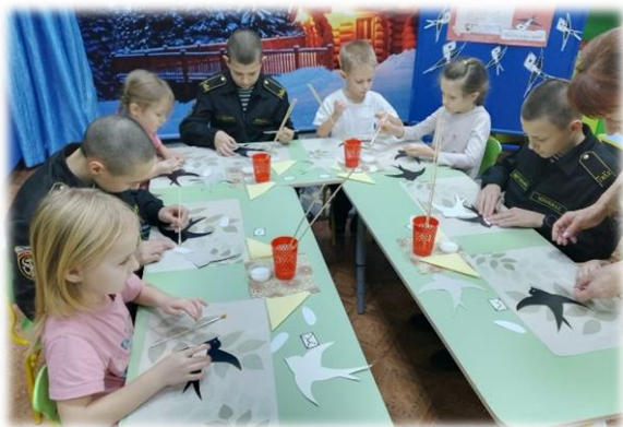
Воспитатель 21 учебной группы

18 января 2024 года кадеты 7 «А» класса совместно с воспитанниками подготовительной группы детского сада «Красная шапочка» провели мастер-класс по созданию «Блокадной ласточки» - символа надежды и освобождения — ласточки с письмом в клюве, приуроченного к патриотической акции «Блокадная ласточка». Акция посвященная героизму и подвигу ленинградцев. Мероприятие началось с рассказа об истории возникновения блокадной ласточки символе акции — маленьком жестяном значке. Дети совместно с кадетами создали аппликацию «Блокадная ласточка» — как символ «добрых вестей». Дети с большим воодушевлением занимались творческой деятельностью: вырезали, наклеивали, складывали из бумаги, делали птичек. Пусть блокадная ласточка летит сквозь время! Память живет в наших сердцах.